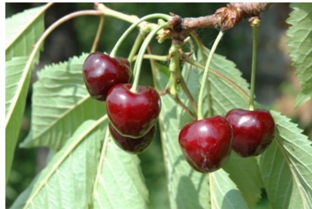
Schöne aus Marienhöhe