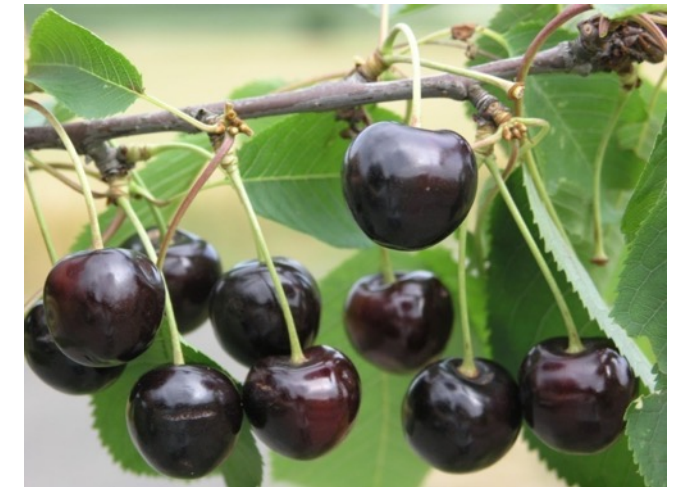
Schubacks Frühe Schwarze