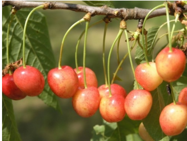
Flamentiner (Türkine, Leggeske)