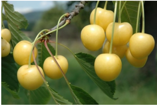
Dönissens Gelbe Knorpel