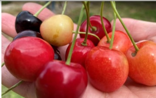
Bunte Vielfalt - Kirschen des Jahres in