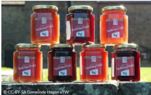
Hagen a.T.W. und seine süßen Kirschen