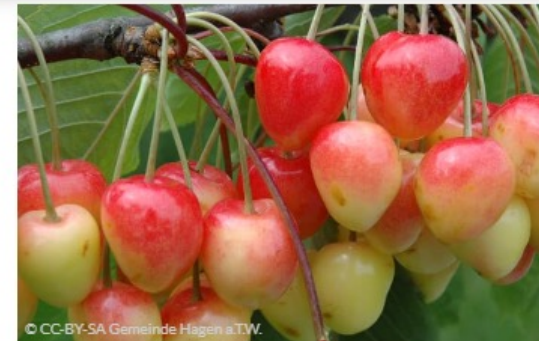
Naschen erlaubt - aber mit Vorsicht!